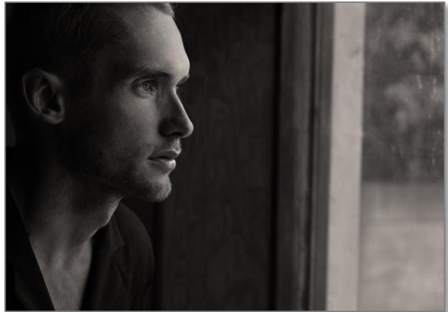
Een gedachte is als een entiteit

Wij hebben als mens de neiging om ons direct te identificeren met hetgeen wij denken. Wij beschouwen onze gedachten als de absolute waarheid. Een gedachte is als een entiteit. Een entiteit die komt en gaat. Een entiteit welke wilt groeien en daarvoor energie nodig heeft. Zodra een gedachte zich in ons bewustzijn manifesteert vraagt het om aandacht. Indien wij deze vraag beantwoorden, door ons op de betreffende gedachte te focussen, ontvangt de gedachte de benodigde energie om te groeien en zich verder te verankeren in het bewustzijn.